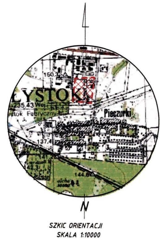
SKZIC ORIENTACJI SKALA 1:10000

W granicach projektowanej inwestycji budowlanej brak obciążeń o których mowa w § 80 ust. 4 Rozporządzenia MSWiA z dnia 9 listopada 2011 (Dz.U.263.poz.1572)